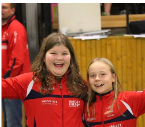
Inför 3-Kungaslaget tog vi fram en overall till samtliga spelare och ledare.