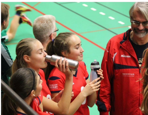
U18-laget har inlett med att vinna de två första omgångarna av Stockholm Volley Cup. En välbehövlig påfyllning av vatten i en time-out.